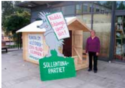
Vår valstuga på Edsbergs torg.

Sollentunapartiet ser ingen motsättning mellan välfärd och valfrihet. Det viktigaste är kvaliteten på verksamheterna och att det verkligen är medborgarens val som är styrande för huvudmannaskapet. Det är viktigt att det finns verksamheter i kommunal regi för de som önskar detta och så att kommunens kompetens behålls. Konkurrensutsättning och avknoppning kan förbättra medborgarnas möjligheter att välja och nyttiggöra sig av den service, undervisning eller omsorg som de önskar, om det är medborgarnas behov som får vara styrande.