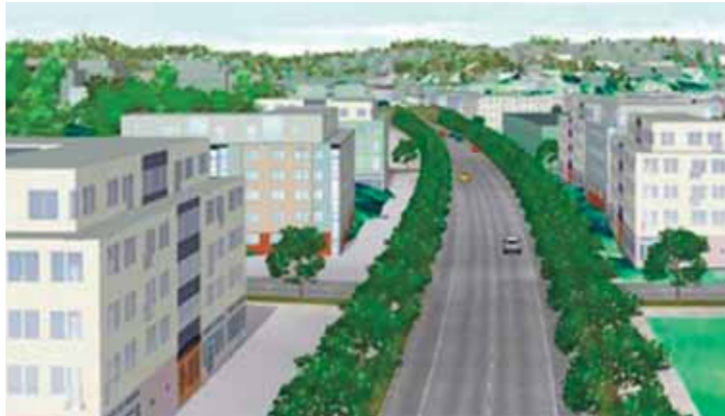
I ett av kommunens nyhetsbrev föreslås bebyggelse och denna nya stora vägförbindelse mellan Väsjöstadens och Edsberg rakt över sportfältet.