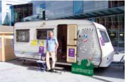
Vår valvagn på Turebergs torg.

Vi vill ha en skola med fasta regler och hög pedagogisk kvalitet.