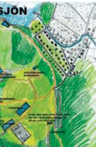
Kommunens egen skiss som visar hur den västra delen av sportfältet byggs sönder med stora hus och en väg mellan Väsjöstadens och Edsberg.